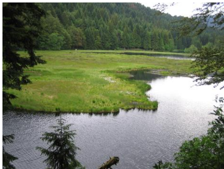
Flachmoor bei Lisbach

Abend: Bezug des Hotels (Hotel „Les Vallées“) in La Bresse, Abendessen im Hotel.