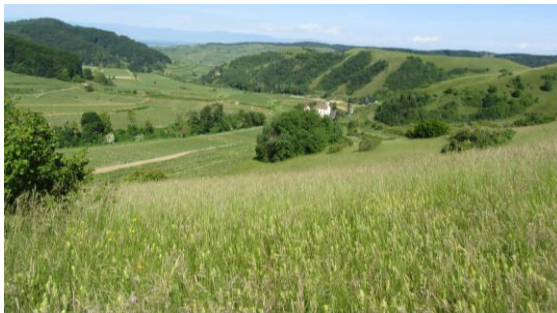
Blick vom Badberg

Nachmittag: Kleiner Snack und Rückfahrt nach Luxemburg. Ankunft in Luxemburg ca. 21.00 Uhr (Bahnhof) / P&R Howald).