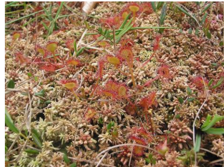
Sonnentau, Moosbeere und Torfmoose