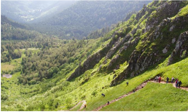
Abstieg vom Hohneck