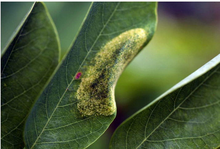
Fig. 2. Mine de Phyllonorycter robiniella , face supérieure (Bonnevoie 2007).