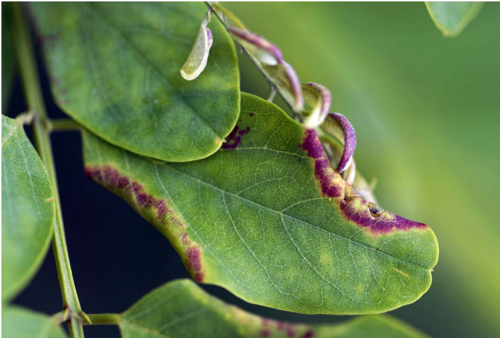
Fig. 4. Galle d' Obolodiplosis robiniae , face supérieure (Bonnevoie 2007).

Itziger Stee 2007 (NS) ; Junglinster, Weimericht, direction Eschweiler 2008 (R. Assa) ; Kueleberg (entre Sandweiler et Oetrange) 2008 (NS) ; Lintgen 2008 (NS) ; Lorentzweiler 2008 (NS et R. Assa) ; Luxembourg (Beggen, Bonnevoie, Eich, gare de Cents-Hamm, Gasperich, Kirchberg centre européen, Limpertsberg, Parc public, Pulvermühle, Rollingergrund, Schleifmühle, Stadtgrund) 2007 et 2008 (NS) ; Mamer 2008 (NS) ; Manternach 2007 (NS) et 2008 (R. Assa) ; Mersch 2008 (NS) ; Mertert 2008 (NS) ; Munsbach 2008 (NS) ; Niederanven 2008 (R. Assa) ; Noertzange 2008 (NS) ; Pétange, Prénzeberg 2008 (NS) ; Reisdorf 2008 (NS) ; Remich 2006 (F. Feitz) ; Rosport (Centre et Hoelt) 2007 (NS) ; Schieren 2008 (NS) ; Senningerberg 2008 (R. Assa) ; Uebersyren 2008 (NS) ; Useldange 2008 (NS) ; Walferdange 2008 (NS et R. Assa) ; Wal-