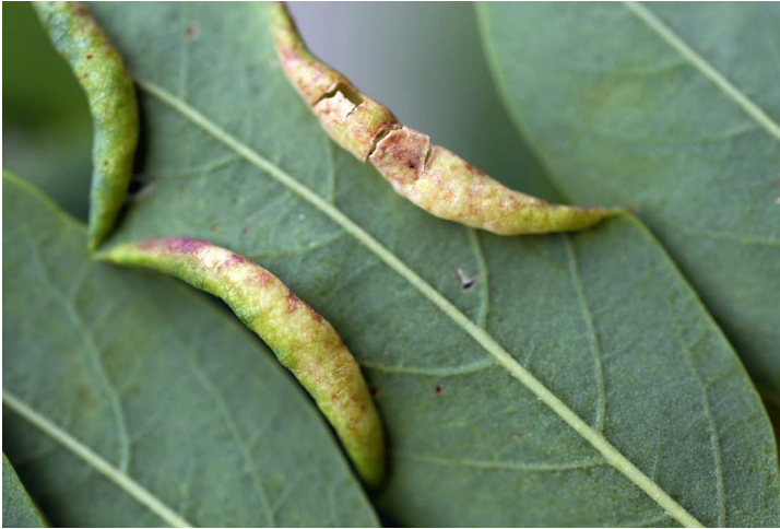
Fig. 3. Galle d' Obolodiplosis robiniae , face inférieure (Bonnevoie 2007).