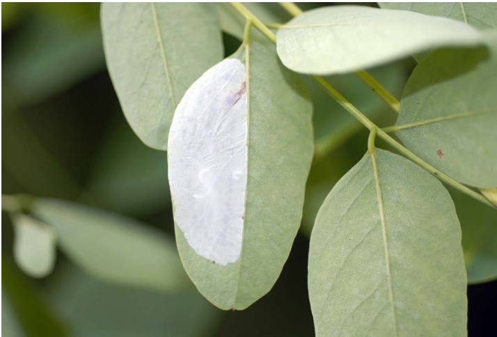
Fig. 1. Mine de Phyllonorycter robiniella , face inférieure (Dudelage 2008).

Boevange et Bissen 2008 (NS) ; Bollendorf-Pont 2008 (R. Assa) ; Consdorf 2008 (R. Assa) ; Cruchten 2008 (NS) ; Diekirch 2008 (R. Assa) ; Dillingen 2008 (R. Assa) ; Dudelage (Burange, Haard, Italie, Réllent, Centre et Usines) 2008 (NS) ; Echternach, parc 2008 (R. Assa) ; Ehnen, près du terrain de football 2008 (NS) ; entre Ehnen et Gostingening 2008 (NS) ; Eischen 2007 (NS) ; Erpeldange-sur-Sûre 2008 (NS) ; Esch-sur-Alzette (gare et Galgebierg) 2007 et 2008 (NS) ; Ettelbruck, Deichwisen 2008 (NS) ; Gantenbeinsmühle 2008 (NS) ; gare de Sandweiler-Contern, site DuPont 2007 et 2008 (NS) ; Gilsdorf 2008 (NS) ; Gonderange, S 2008 (R. Assa) ; Graulinster, Groe Knapp 2008 (R. Assa) ; Grevenmacher 2008 (R. Assa) ; Heisdorf 2008 (NS) ; Howald 2008 (NS) ; Hunsdorf 2008 (NS) ;